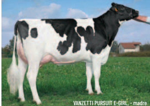
VANZETTI PURSUIT E-GIRL, - madre